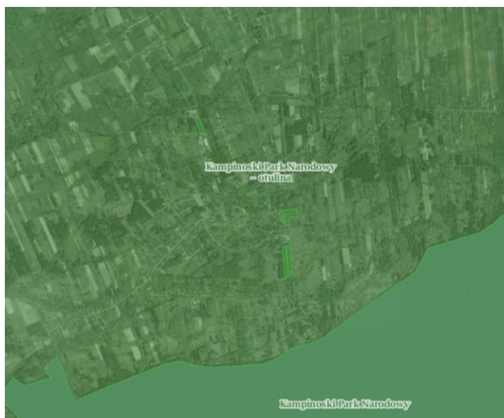
Rys 2 Obszary chronione dotyczące obszaru mpzp

W Parku występują 83 gatunki zwierząt zagrożonych, wpisanych do Polskiej Czerwonej Księgi Zwierząt oraz 280 gatunków objętych ochroną gatunkową. Z terenu Parku opisano 19 gatunków zwierząt nowych dla nauki oraz 14 nowych dla Polski.