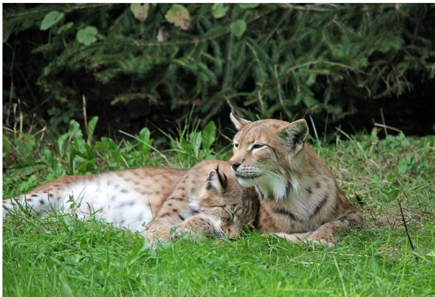
Zdj. 6 Rysie w KPN

W Parku występują 83 gatunki zwierząt zagrożonych, wpisanych do Polskiej Czerwonej Księgi Zwierząt oraz 280 gatunków objętych ochroną gatunkową. Z terenu Parku opisano 19 gatunków zwierząt nowych dla nauki oraz 14 nowych dla Polski.