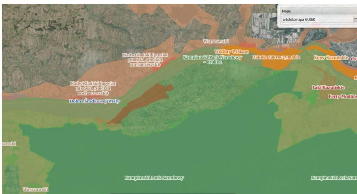
Rys.3 Obszary chronione wokół obszaru opracowania

Obszar znajduje się w części w Kampinoskim Parku Narodowym i w całości w otulinie Kampinoskiego Parku narodowego. Obszar jest objęty jedną z form ochrony wymienionych w art. 6 ust. 1 ustawy z dnia 16 kwietnia 2004 r. o ochronie przyrody (tj. Dz. U. z 200poz. 627 z późn. zm.) – Kampinoski Park Narodowy. W pobliżu obszaru planu znajdują się: