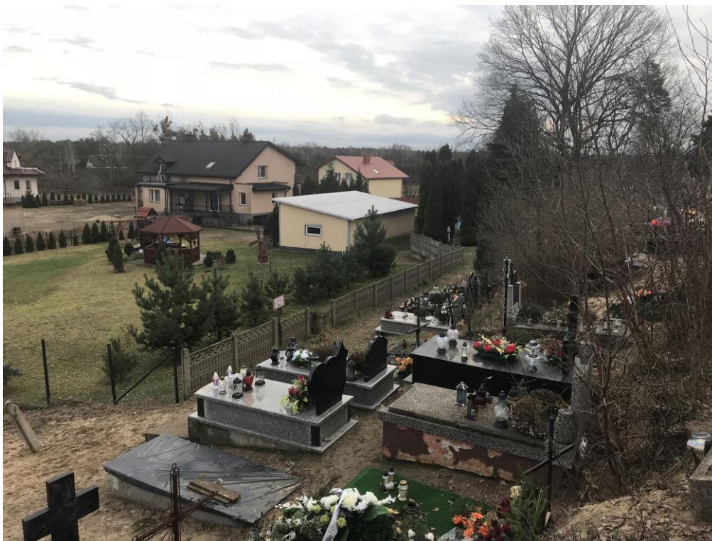
Fot.7 Istniejący cmentarz

Lokalizacja cmentarza spełnia wszystkie wymagania w/w rozporządzenia Ministra Gospodarki Komunalnej z dnia 25 sierpnia 1959 r. Lokalizacja cmentarza nie będzie miała negatywnego wpływu na zdrowie ludzi.