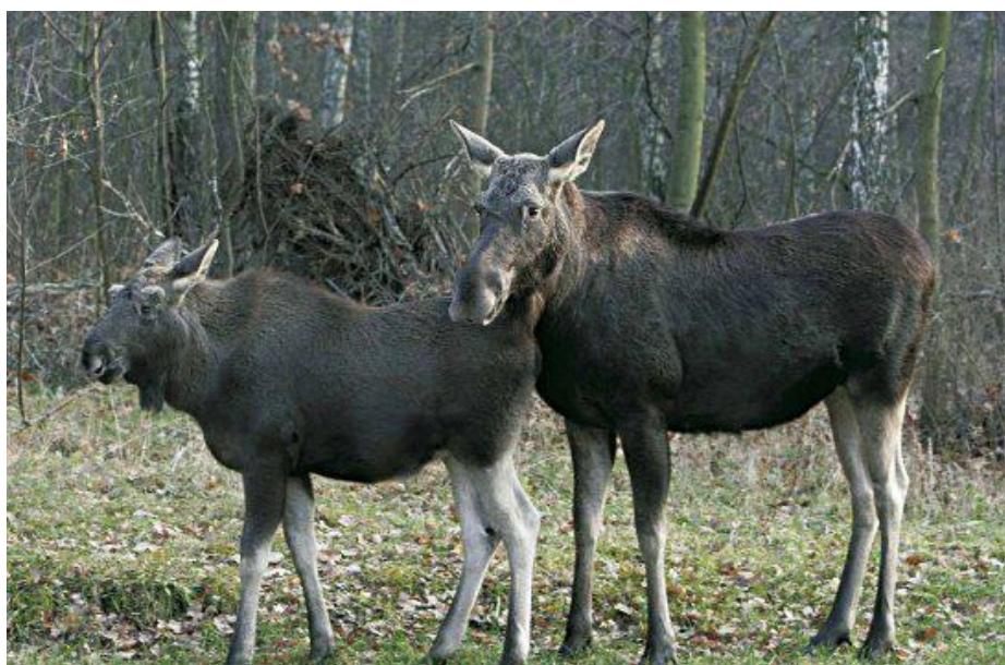
Zdj.4 Łosie w KPN

Pod ochroną ścisłą 4 638 ha (22 wydzielone obszary), wokół Parku strefa ochronna (otulina) o pow. 37 756 ha. 70% powierzchni Parku stanowią lasy. Podstawowym gatunkiem lasotwórczym jest sosna, a dominującym siedliskiem - bór świeży. Symbolem Parku jest łoś.