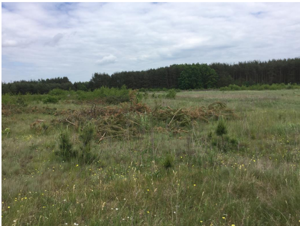
Zdj. 1 Pola i zadrzewienia w północnej części wsi Leoncina

Strefa centralna, przejściowa, charakteryzuje się przeciętnymi walorami przyrodniczymi szaty roślinnej. Zabudowie mieszkaniowej towarzyszą drzewa i krzewy ozdobne, drzewa owocowe. Duże znaczenie przyrodnicze i krajobrazowe mają zadrzewienia, zakrzewienia i pojedyncze drzewa śródpolne. Ich utrzymanie i uzupełnianie jest ważne w celu zachowania równowagi biologicznej, a także z przyczyn gospodarczych.