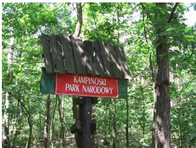
Zdj.3 Oznakowania Kampinoskiego Parku Narodowego

Kampinoski Park Narodowy leży w województwie mazowieckim, na północny - zachód od Warszawy, z którą bezpośrednio sąsiaduje. Obejmuje fragment pradoliny Wisły w Kotlinie Warszawskiej, gdzie występuje duży kompleks leśny Puszcza Kampinoska.