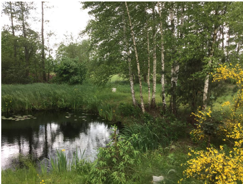
Zdj.2 Niewielki zbiornik wody w Leoncinie