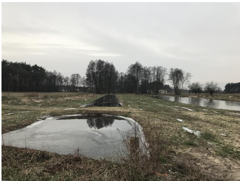
Zdj. 1 Oczyszczony rów melioracyjny i oczko wodne.

Północną granicę gminy Leoncin stanowi rzeka Wisła przepływająca na odcinku ok. 18 km od 554 do 572 km biegu rzeki. Rzeka leży poza granicami planu, jednakże ma bezpośredni wpływ na kształtowanie struktury funkcjonalno – przestrzennej. Ponadto przez obszar planu przebiega sieć rowów szczegółowych figurujących w prowadzonej przez WZMiUW ewidencji wód. Wysoki poziom wód gruntowych występuje też w obszarach leśnych. Zdj. 2