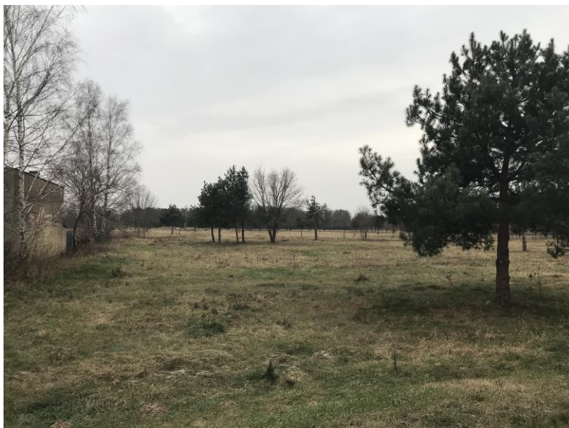
Zdj. 3 Pola i pojedyncze zadrzewienia