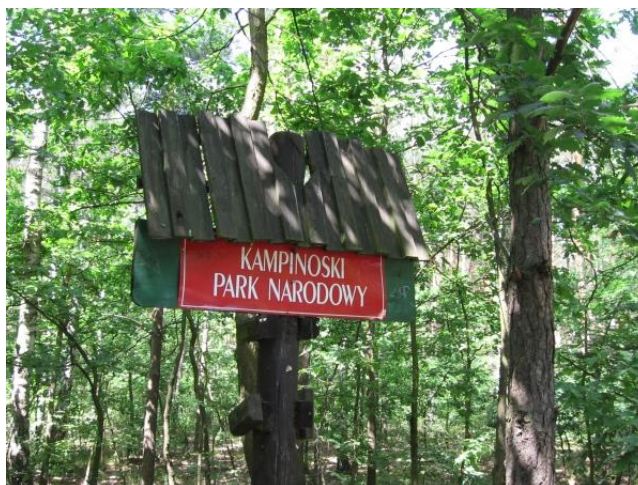
Zdj.4 Oznakowania Kampinoskiego Parku Narodowego

Kampinoski Park Narodowy leży w województwie mazowieckim, na północny - zachód od Warszawy, z którą bezpośrednio