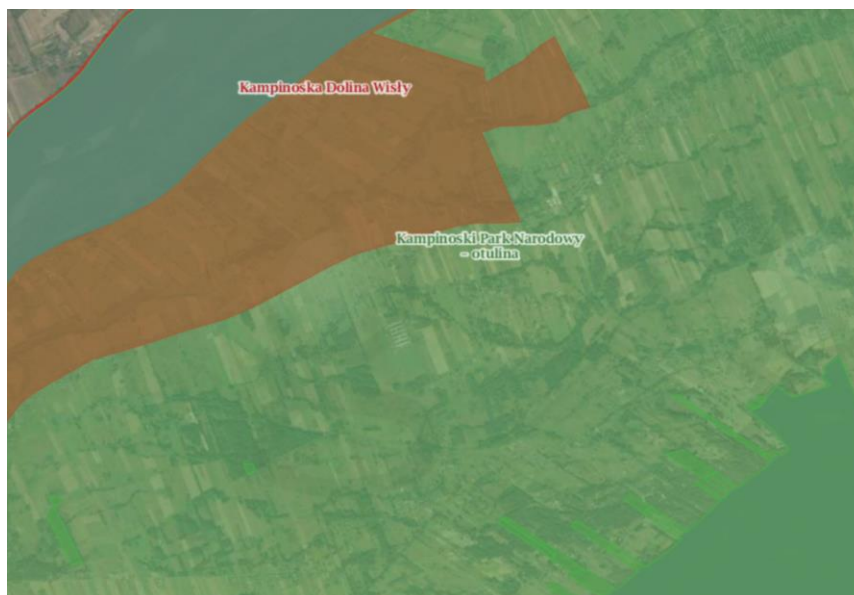
Rys 5 Obszary chronione dotyczące obszaru mpzp

W przypadku braku realizacji planu, przy braku ingerencji o charakterze gospodarczym, teren pokryje się drzewostanem, z którego mogą się z czasem wykształcić zbiorowiska leśne, być może o charakterze borowym.