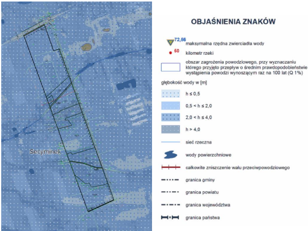
Rys. 3 Mapa zagrożenia powodziowego wraz z głębokością wody. Obszary narażone na zalanie w przypadku zniszczenia lub uszkodzenia wału przeciwpowodziowego

narażonego na zalanie w przypadku zniszczenia lub uszkodzenia wału przeciwpowodziowego. Cały obszar działki 93/3 leży w obszarze narażonym na zalanie w przypadku zniszczenia lub uszkodzenia wału przeciwpowodziowego.