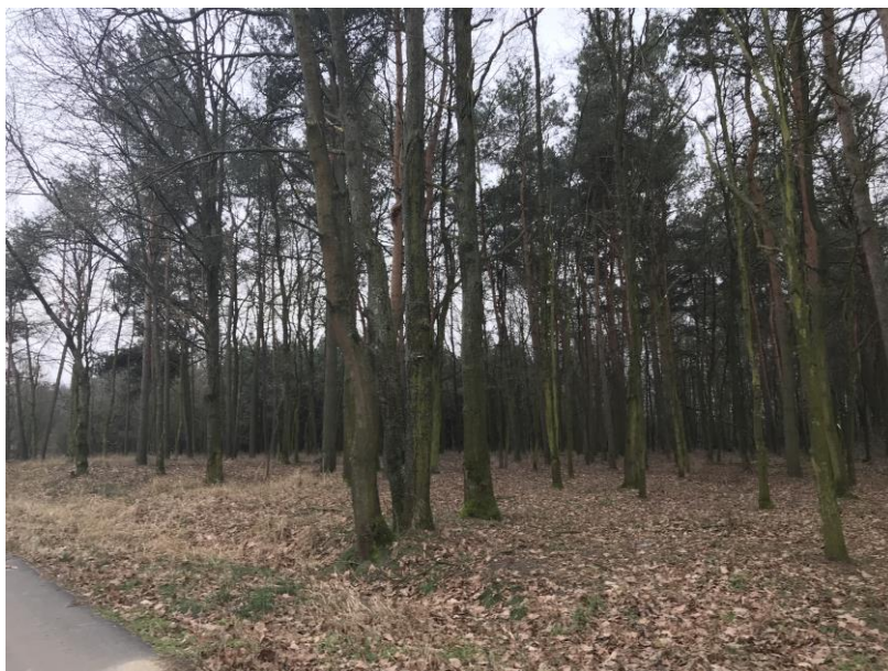
Zdj.9. Tereny leśne w granicach opracowania