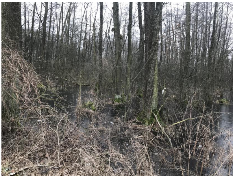
Zdj.2 Teren leśny