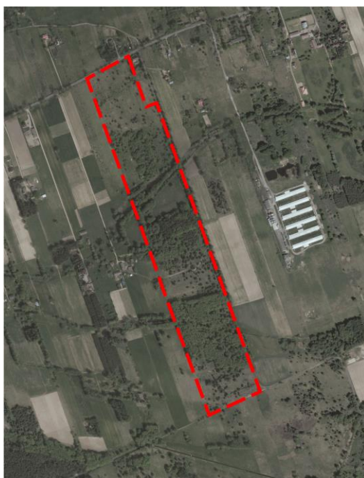
Mapa .1. Położenie działki - ortofotomapa

Wokół Kampinoskiego Parku Narodowego wyznaczona jest strefa ochronna tzw. otulina o powierzchni 37 756,49 ha. Według ustawy o ochronie przyrody otulina parku narodowego nie jest formą ochrony przyrody, ale może być w niej utworzona strefa ochronna zwierząt łownych ze względu na potrzebę ochrony zwierząt w parku narodowym. Granica otuliny przebiega: od północy brzegiem Wisły, od wschodu przez teren dzielnicy Bielany i Bemowo w Warszawie, od południa przez teren gmin Stare Babice, Leszno i Kampinos (w przybliżeniu po działę wodnym pomiędzy Utrącią i Łasicą), od zachodu – doliną Bzury (po granicy gminy Brochów i teren gminy Młodzieszyn).