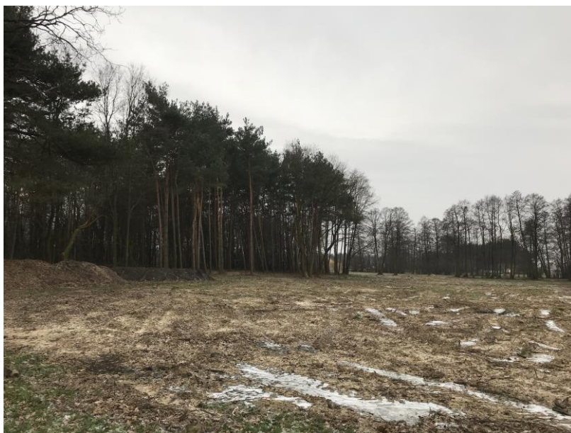
Zdj.8. Uporzędzony teren w sąsiedztwie gruntów leśnych

Należy zauważyć, że z chwilą przeznaczenia (w mpzp) określonych terenów pod zabudowę, krajobraz kształtowany będzie przez właściciela działki budowlanej, inwestorów, a w mniejszym stopniu przez gminę. Zatem ten element środowiska podatny będzie na różnego rodzaju transformacje, zależne od indywidualnych podmiotów.