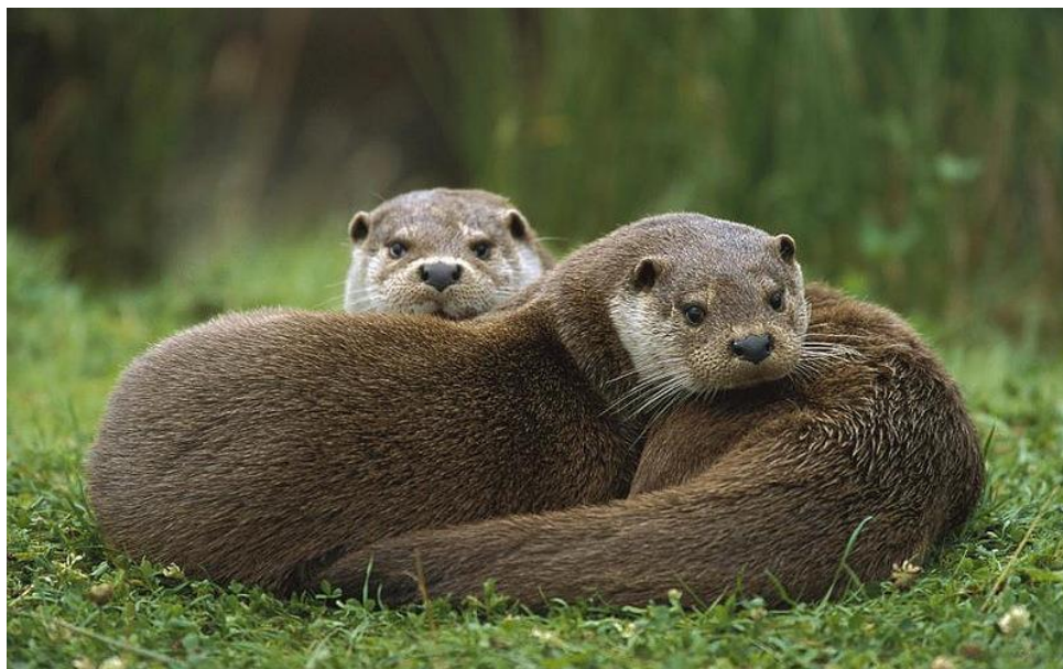
Zdj.6 Wydry w KPN

Park i współczesna dolina nieuregulowanej Wisły ze starorzeczami, piaszczystymi łachami, wyspami, łęgami i zaroślami stanowią niezwykle ważne biotopy dla wielu gatunków roślin i zwierząt. Fauna Parku jest bogata - według naukowców obejmuje około 16 000 gatunków.