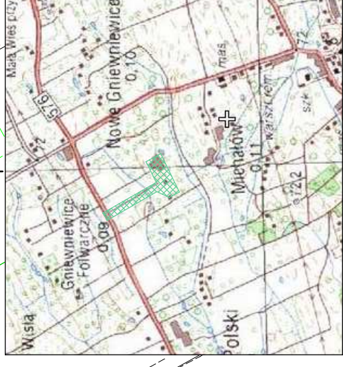
ORIENTACJA W SKALI 1:25000